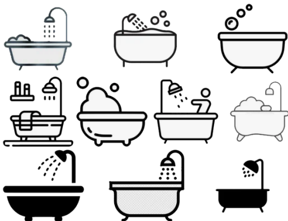
Рис. 1. Образцы знаков ванной комнаты