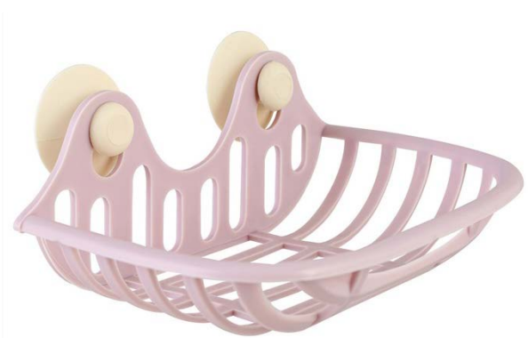
Рис. 1. Пример изделия «Мыльница настенная»