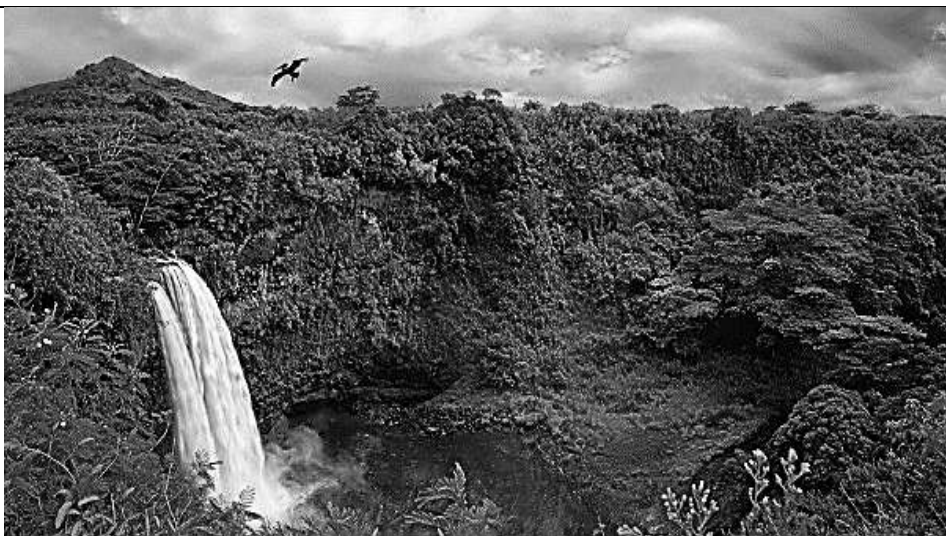
В. Объект ЮНЕСКО, национальный парк Ноэль-Кемпфф-Меркадо