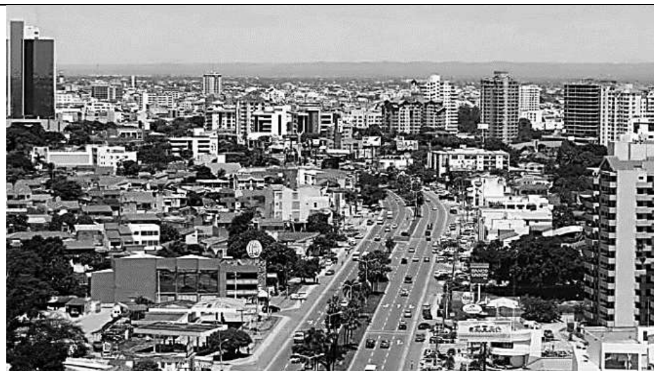
Г. Крупнейший по численности населения город страны