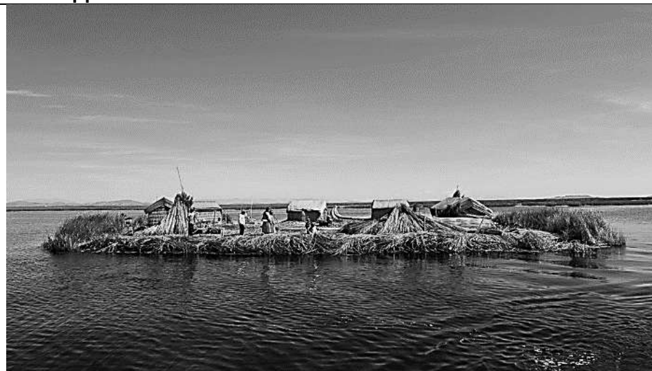
Б. Самое высокогорное судоходное озеро мира (крупнейшее по запасам пресной воды на материке) и островные жилища народа уру