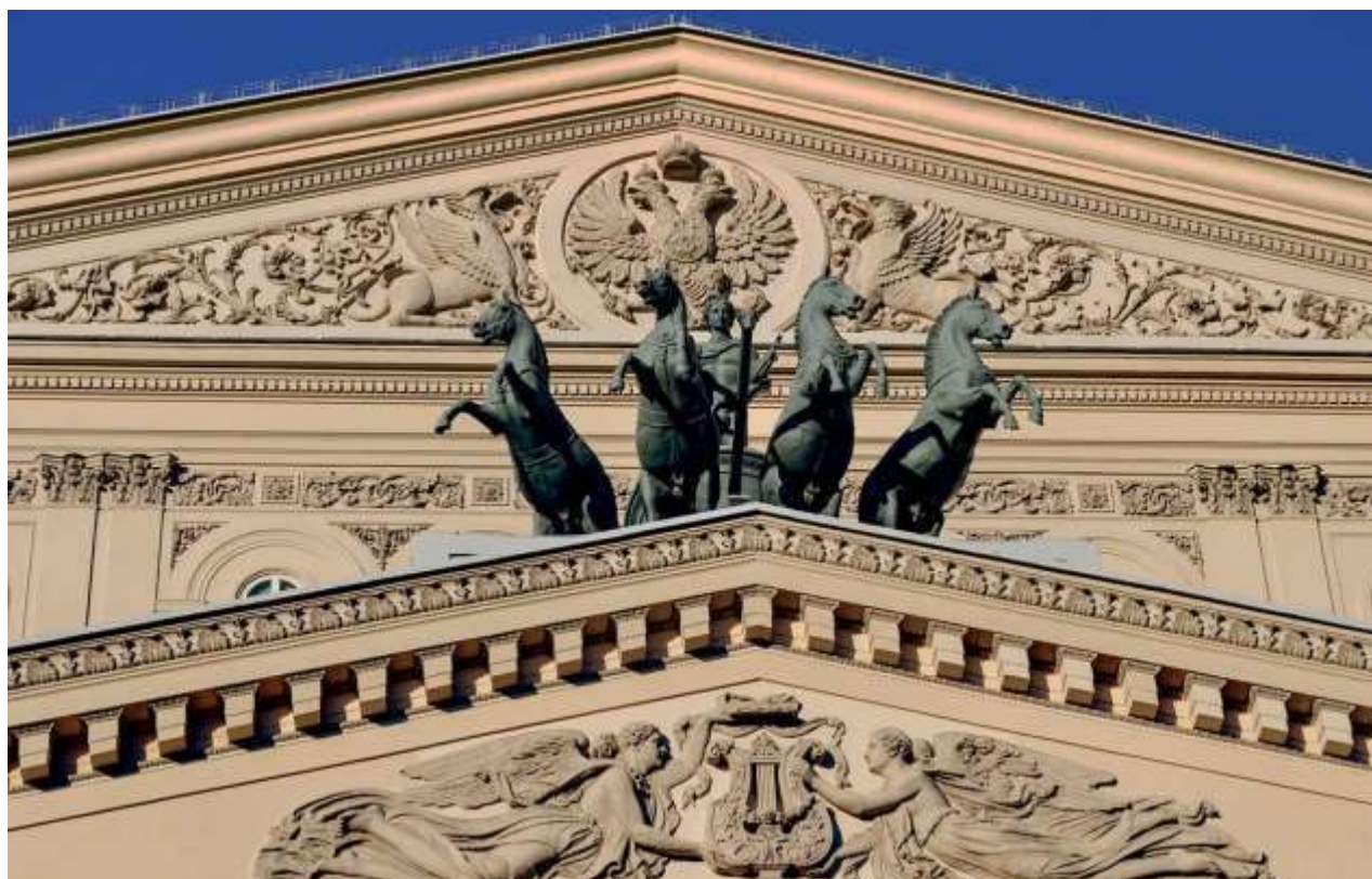
Рис. 2 Фронтон Большого театр