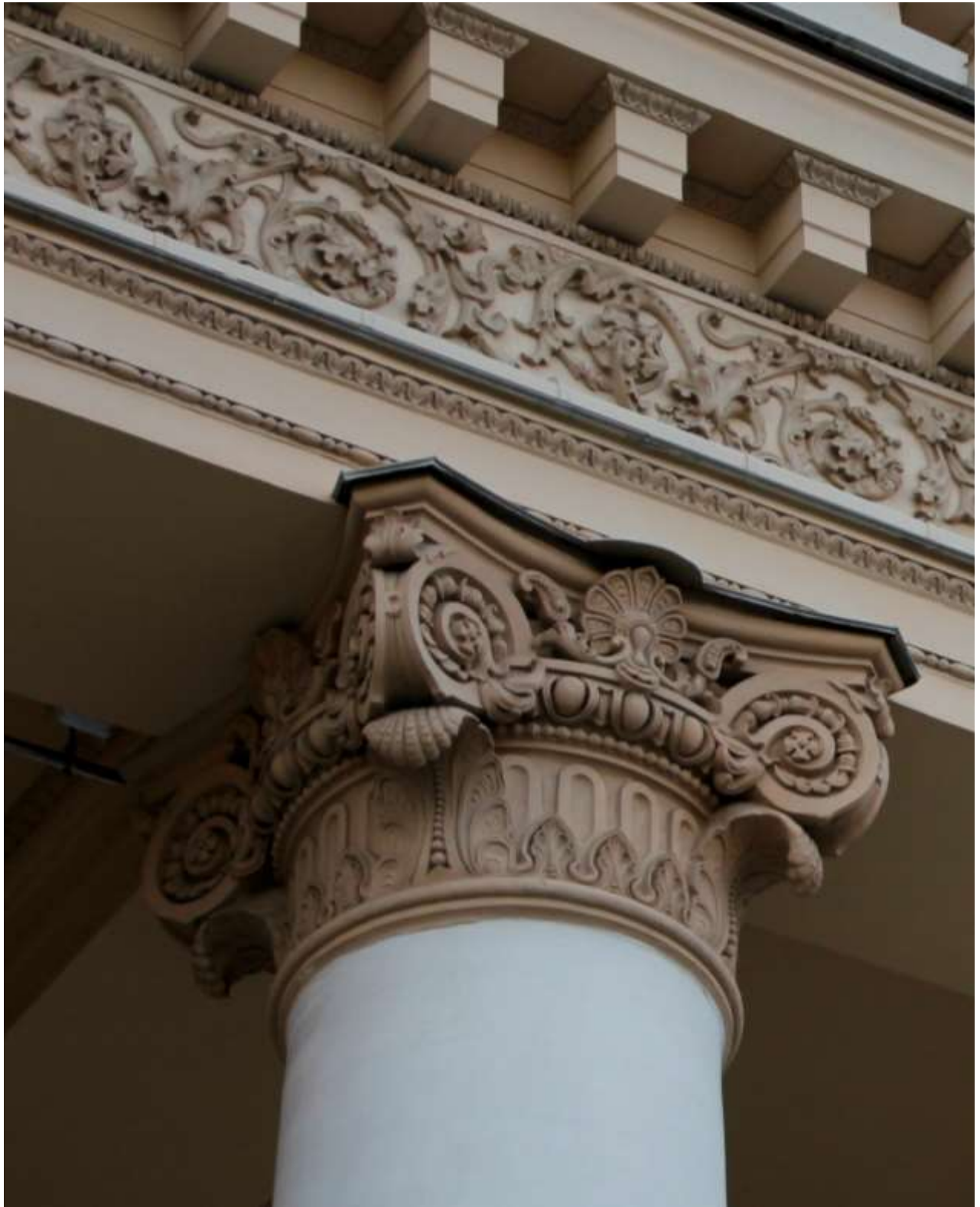
Рис. 4. Капитель Большого театра (фрагмент)