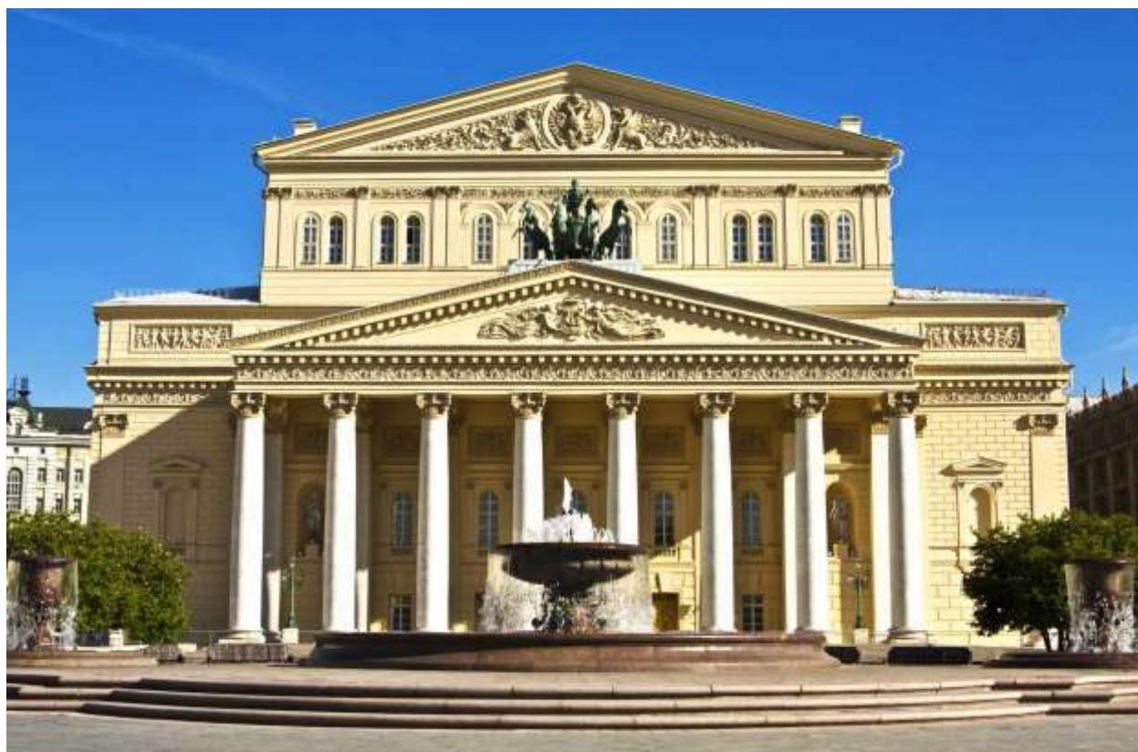
Рис. 1. Москва. Большой театр

Большой театр – объект культурного наследия народов России федерального значения.