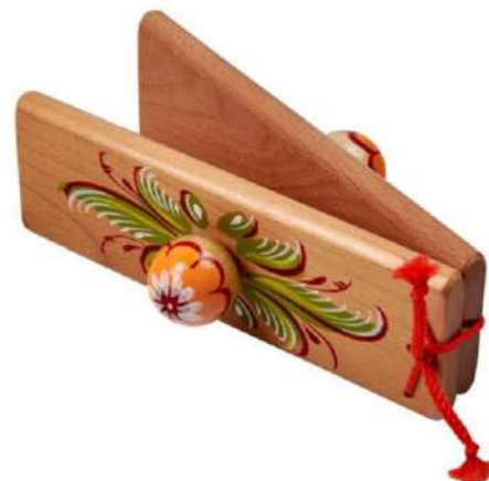
Рисунок 1. Русский народный шумовой музыкальный инструмент «ХЛОПУШКА» (вариант образца изделия)

Габаритные размеры изделия: 10x100x450 (мм). Предельные отклонения размеров \pm 1 мм.