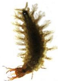
личинка жука- водолюба

Среди представленных животных, выберите тех, у кого и взрослое насекомое, и личинка развиваются в водной среде