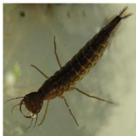
личинка Жука- плавунца