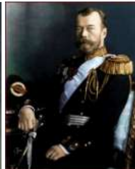
Художник Е. Ботман. Портрет