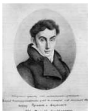
Портрет с надписью «Победителю ученику...»