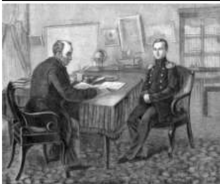
В.А. Жуковский с царевичем

«Вдохновенный художник, воплощая свои созерцания в чувственных формах, есть связующее звено или посредник между миром вечных идей, или первообразов, и миром вещественных явлений. Художественное творчество, в котором упраздняется противоречие между идеальным и чувственным, между духом и вещью, есть земное подобие творчества божественного, в котором снимаются всякие противоположности, и божество проявляется как начало совершенного единства, — "единства себя и своего другого"..."» Вл. Соловьев.