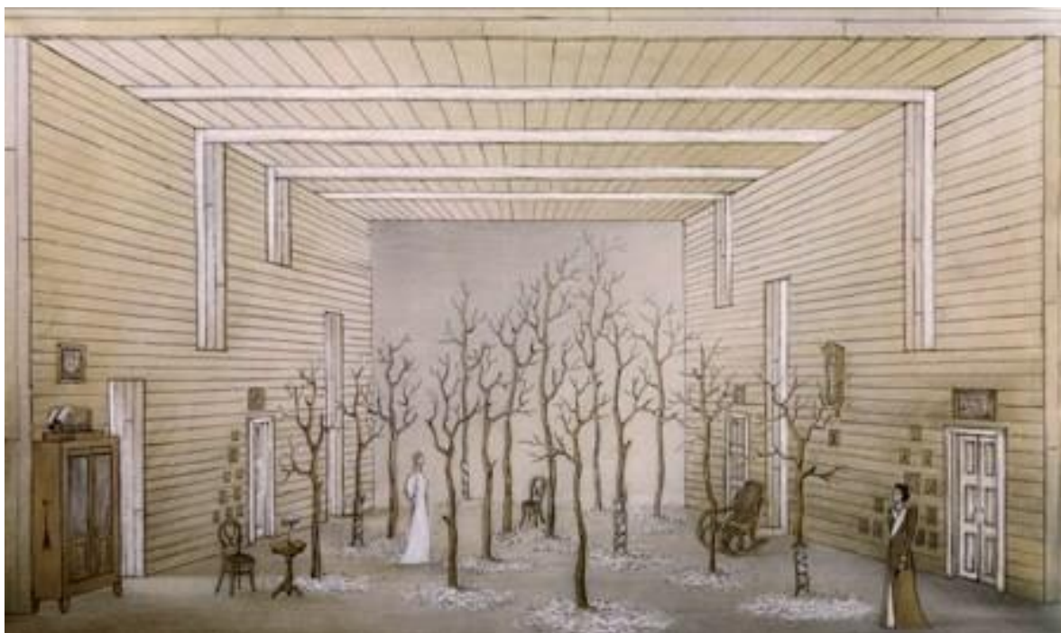
Художественное оформление спектакля – Эдуарда Кочергина.