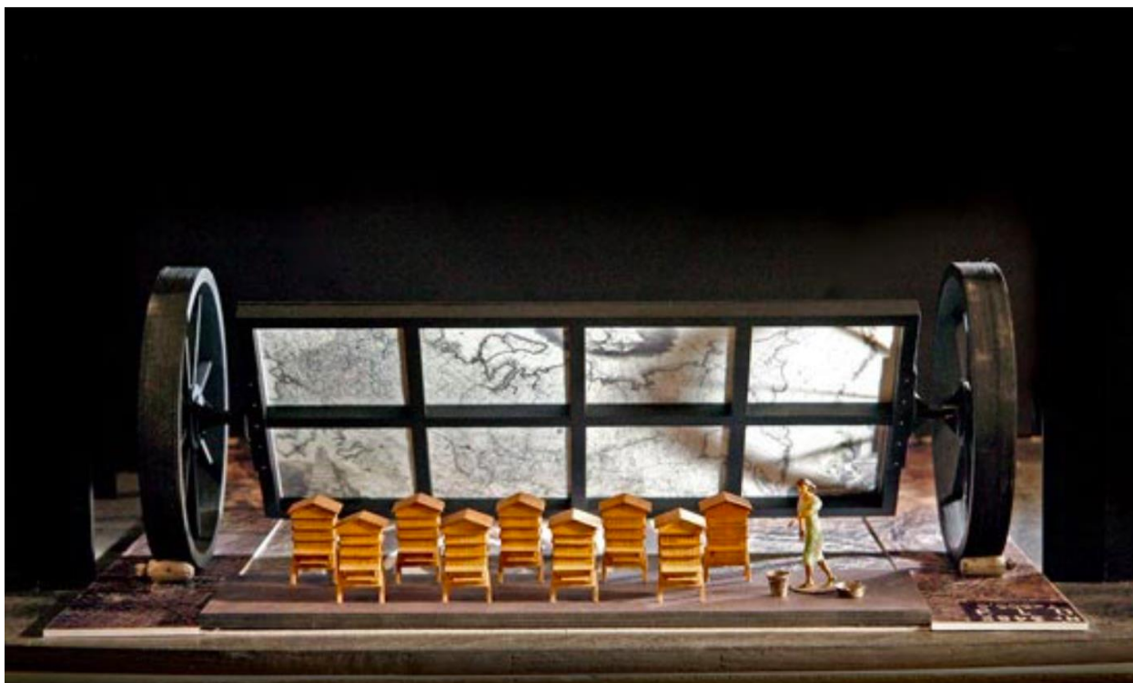
Художественное оформление спектакля – Зиновия Марголина.