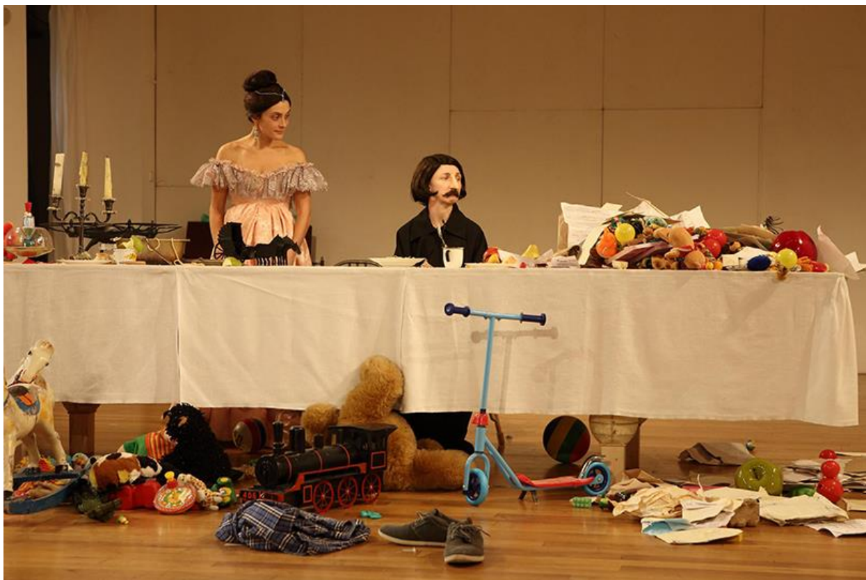
Художественное оформление спектакля – Анны Костриковой и Дмитрия Крымова.