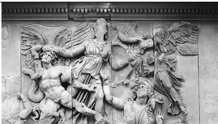
6. _____ _____ _____