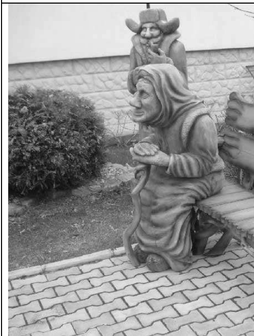
7. _____ _____