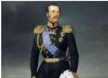
Художник Е.И. Ботман. Портрет Императора Александра II – 2 балла (за определение имени изображенного на иллюстрации).

29 января – 230 лет со дня рождения русского поэта Василия Андреевича Жуковского (1783–1852) 1 балл (за уместное использование раздаточного материала)