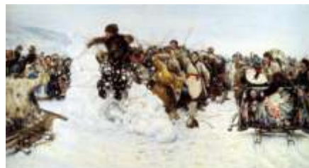
И. Суриков. Взятие снежного городка. Русский музей

музее также находится около четырёхсот полотен А. И. Куинджи, уникальное наследие скульптора А. С. Голубкиной, художников А. П. Остроумовой-Лебедевой и П. Н. Филонова.