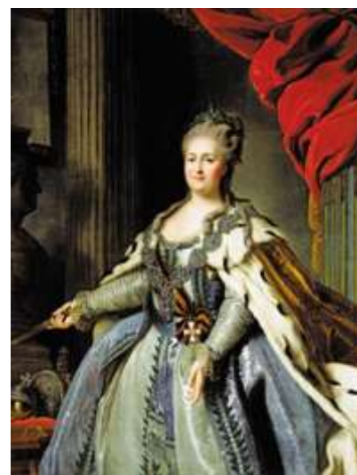
Федор Степанович Рокотов Портрет Екатерины II

Именно ее указом (1764) по инициативе И. И.