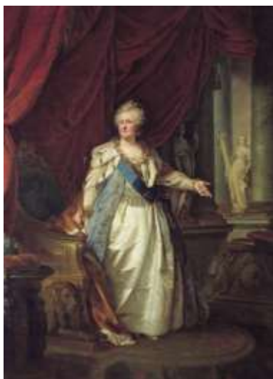
Иоганн Лампи (старший) Портрет императрицы Екатерины II с аллегорическими фигурами. Изображение дано для сравнения

Бецкого был открыт Институт благородных девиц («Императорское воспитательное общество благородных девиц»), положивший основу женскому образованию в России. 2 балла (за указание на культурное событие).