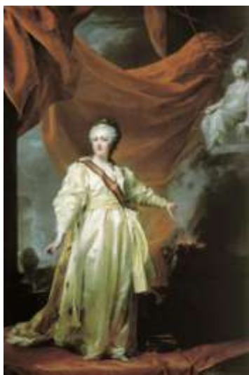
Д.Г.Левицкий. Портрет Екатерины II в храме богини Правосудия. Русский музей.

Ряд актов, способствующих развитию наук и искусств в России, был связан с правлением Екатерины II . (по 1 баллу за использование к месту иллюстраций = 2 балла ; по 2 балла за верное определение изображенной на иллюстрациях = 4 балла ).