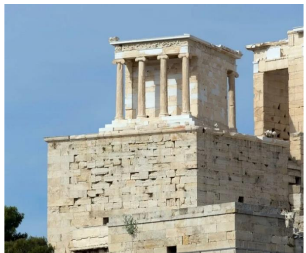
6. Храм Ники Аптерос в Афинах