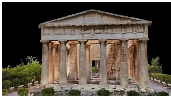
2. Гефестион в Афинах