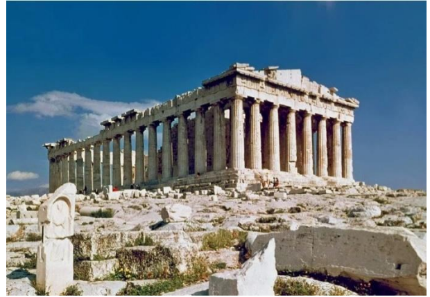
10. Парфенон в Афинах