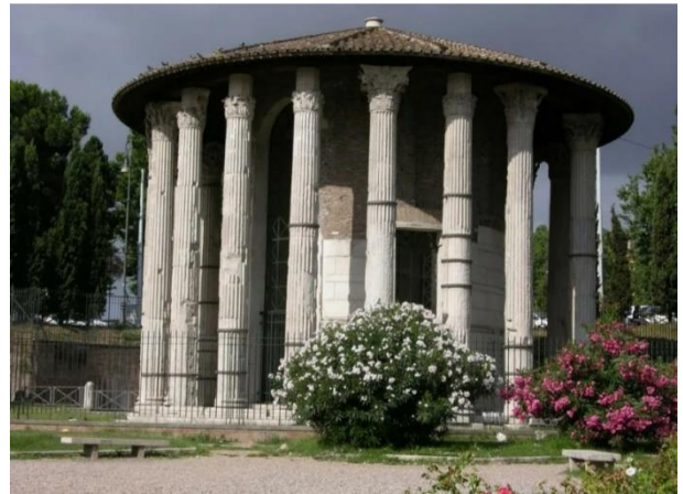
4. Храм Геркулеса Победителя на Бычьем форуме в Риме