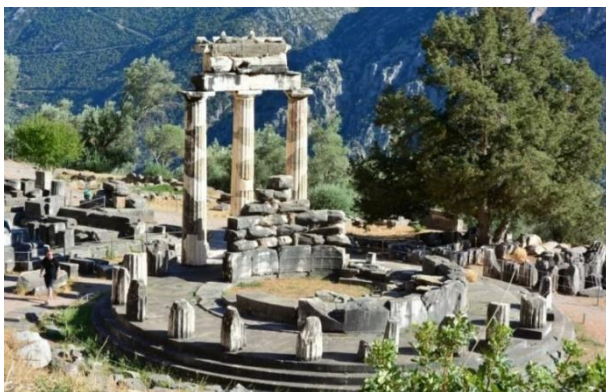
7. Храм Афины Пронайи в Дельфах