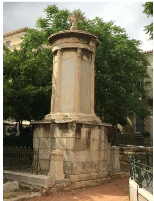
8. Памятник Лисикрата в Афинах