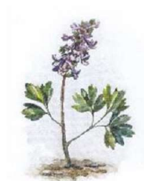
е) Хохлатка плотная