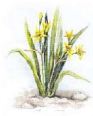
б) Гусиный лук, или Гейджия