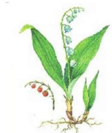
а) Ландыш майский

Весеннецветущие растения, или первоцветы — это многолетние травянистые растения с непродолжительным периодом цветения. Выберите первоцвет, у которого в распространении семян участвуют муравьи. Данный вид занесён в Красную книгу города Москвы.