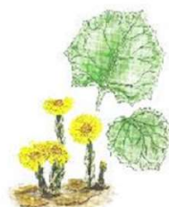
в) Мать-и-мачеха обыкновенная