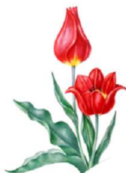
д) Тюльпан Шренка