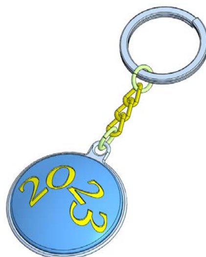
Рис.3. Образец 3D-модели брелока на цепи с кольцом

Габаритные размеры: не более 180×60×30 мм, не менее 120×40×10 мм.