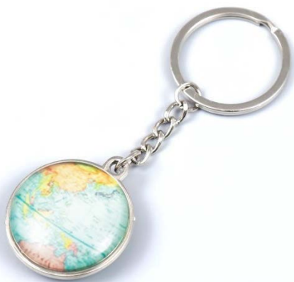
Рис.1. Образец изделия «Брелок на цепи с кольцом»