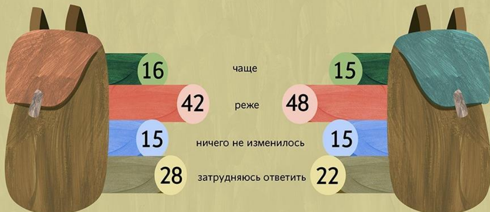
Население в целом