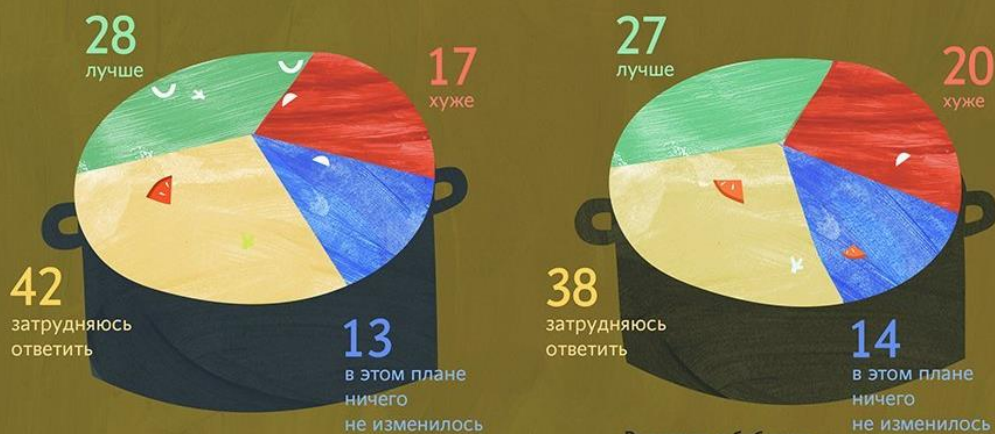
Население в целом