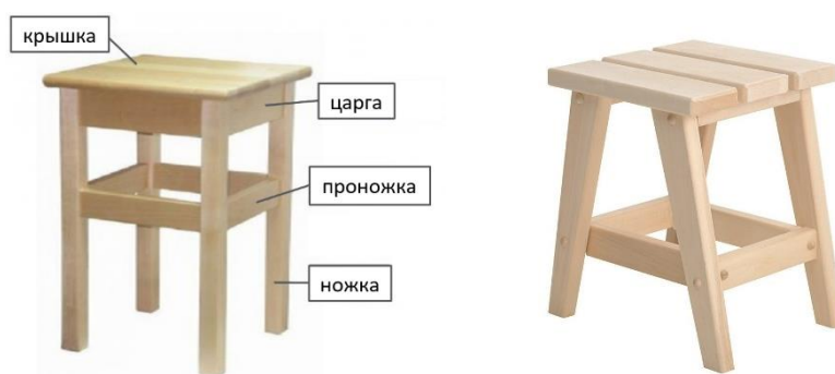
Рис.1. Варианты изделия «Табурет»

Габаритные размеры изделия: не более 60×60×80 мм, не менее 30×30×45 мм.