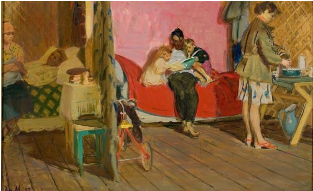
Д. Мочальский. «Новосёлы. Из палатки в новый дом» (1957)