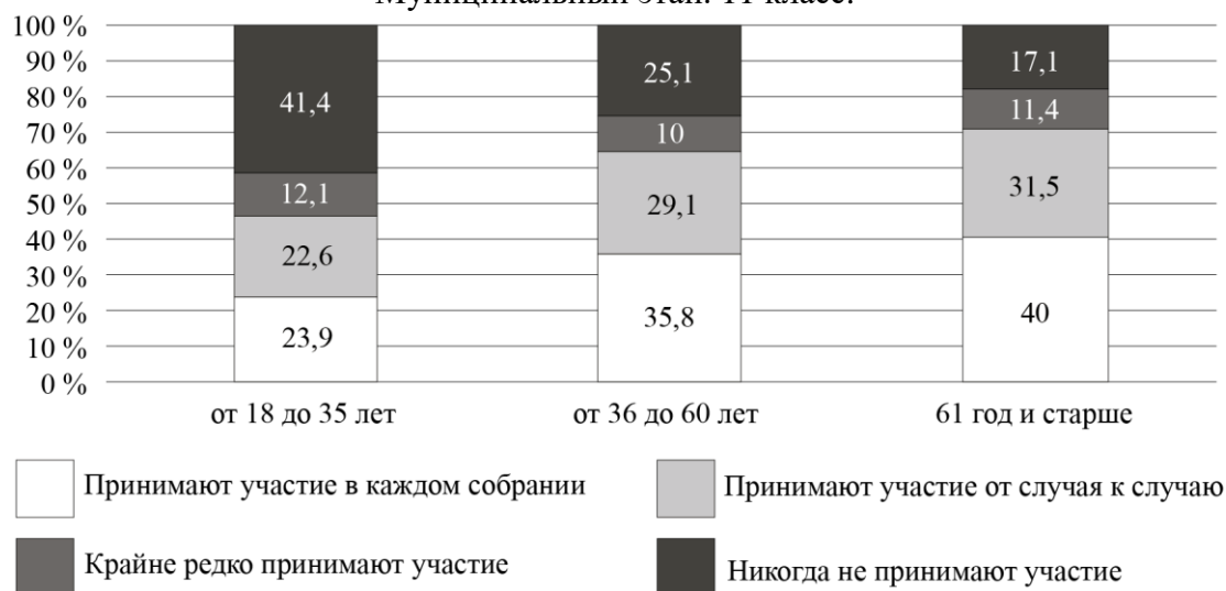
Рис. 3. Дифференциация участия собственников в ОС по возрасту (%)