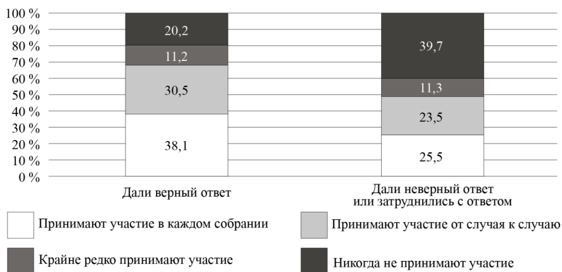
Рис. 6. Дифференциация участия собственников в ОС по знанию состава общего имущества в МКД (%)