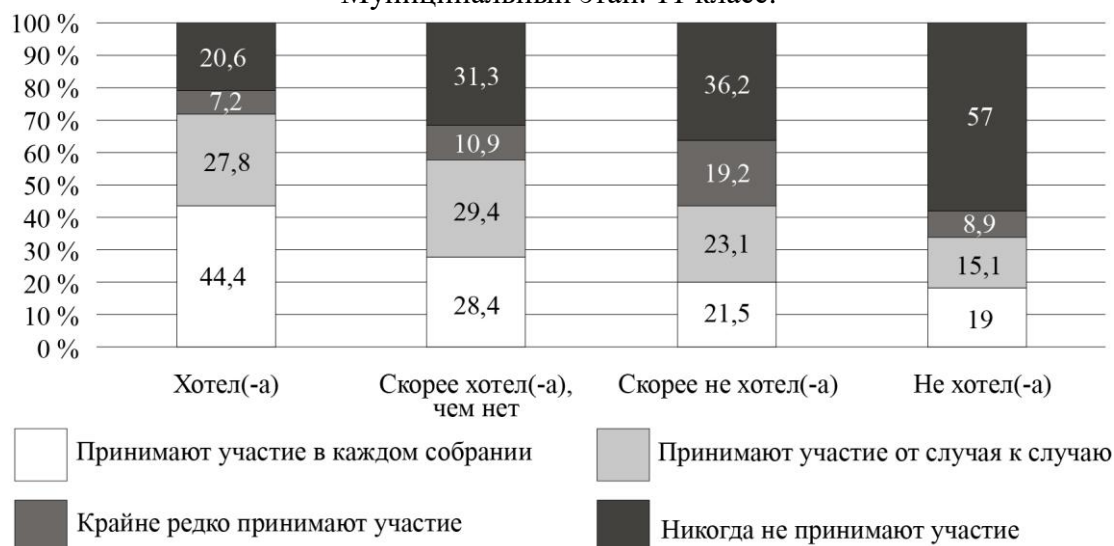
Рис. 7. Дифференциация участия собственников в ОС по желанию иметь квартиру в конкретном МКД (%)

6.1. На основании анализа диаграмм выберите верные утверждения о характеристиках регулярных участников ОС по сравнению с остальными жильцами МКД.