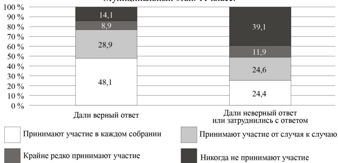
Рис. 5. Дифференциация участия собственников в ОС по знанию органа управления МКД (%)