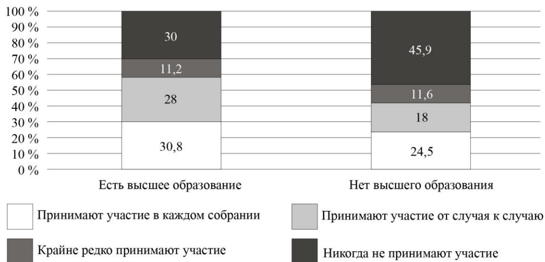
Рис. 4. Дифференциация участия собственников в ОС по образованию (%)