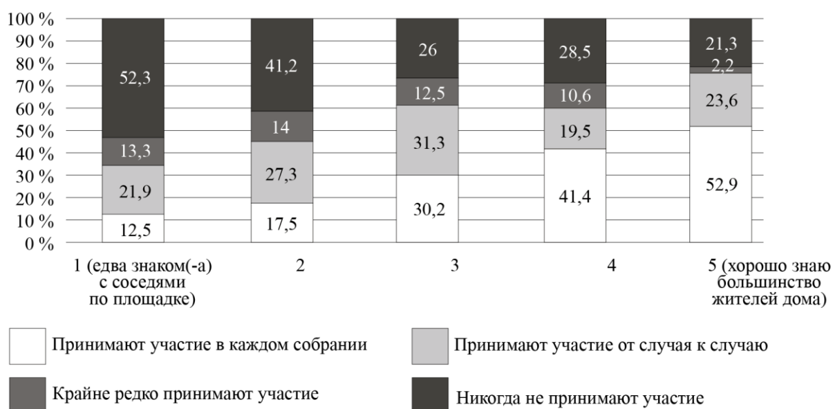
Рис. 2. Дифференциация участия собственников в ОС по степени знакомства с соседями (%)