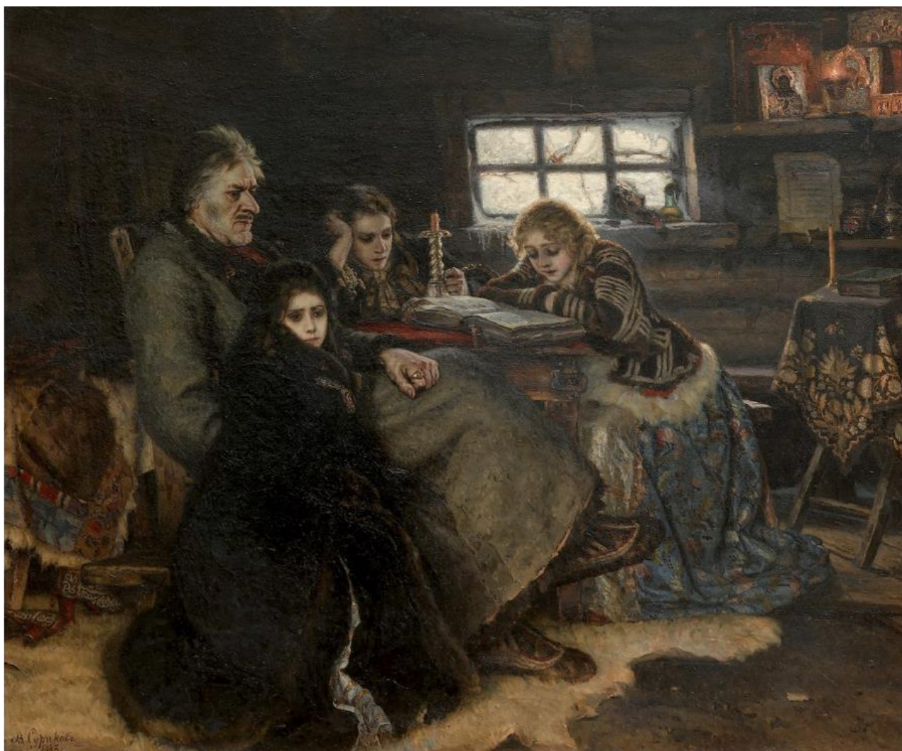
Василий Суриков, Меншиков в Берёзове, 1883 г., Государственная Третьяковская галерея, Москва

6. Перед Вами изображение картины Василия Сурикова «Меншиков в Берёзове». Внимательно рассмотрите изображение картины, прочитайте текст – описание истории создания и сюжета художественного произведения.