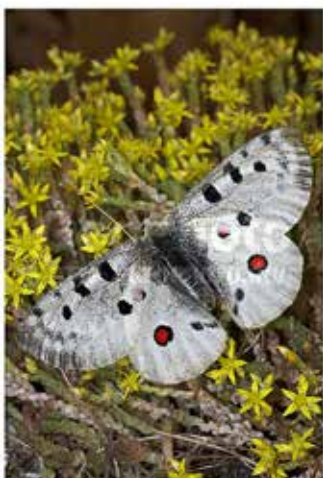
Аполлон обыкновенный на Очитке едком

Аполлон обыкновенный – представитель семейства Парусников отряда Чешуекрылых. Места обитания: луга, горные луга, степи, открытые пространства. Кормовые растения гусениц – виды семейства Толстянковых (суккуленты родов Очиток и Молодило). Зимуют новорожденные гусеницы, находясь в оболочке яйца, у некоторых подвидов – вне оболочки. Известны случаи досрочного выхода зимующих гусениц из яйца при сильных оттепелях зимой и ранней весной. Вид обладает слабой способностью к миграциям при сильно удалённых друг от друга популяциях.