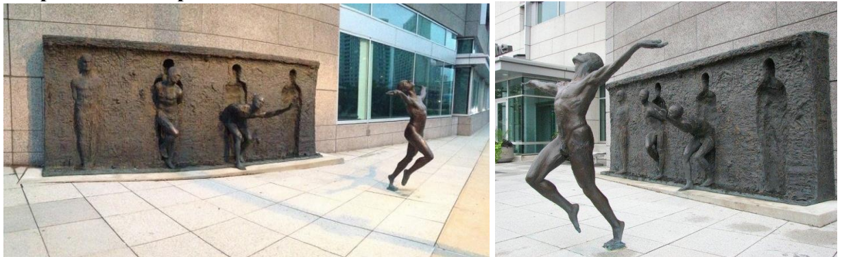
Зенос Фрудакис (Филадельфия) "Свобода"