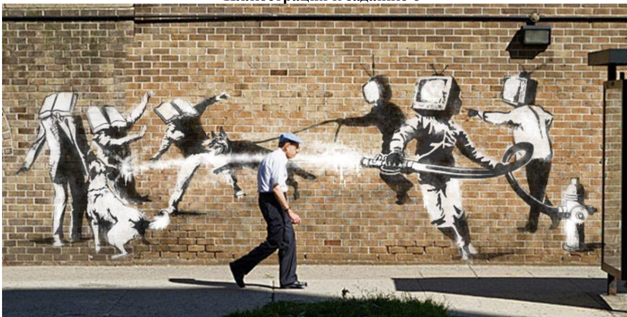
Иллюстрация к заданию 6

В октябре 2018 года на аукционе Sotheby's в Лондоне разразился скандал вокруг работы этого художника 2006 года «Девочка с воздушным шаром» – единственной, выполненной на холсте акриловыми красками: сразу после удара молотка и объявления о продаже в золоченой раме, куда была заключена работа, включился механизм, который изрезал часть холста на мелкие полоски. Автор работы признался, что несет ответственность за произошедшее. Цена испорченной работы увеличилась в несколько раз.