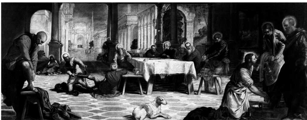
Якопо Тинторетто «Омовение ног» (Венеция, сер. XVI века)