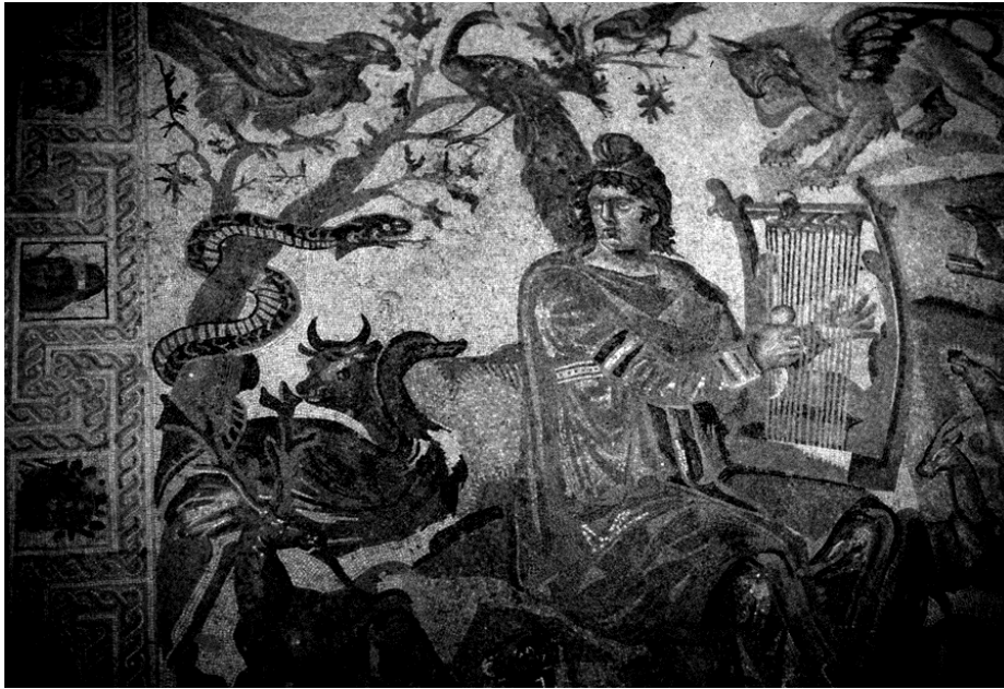
Орфей, мозаика из города Филиппополиса, Сирия, 4 век

Б) Посмотрите на мозаику из античного города Филиппополиса, на которой изображён античный герой Орфей. Этот образ, особенно популярный в эпоху поздней античности и раннего христианства, был во многом близок образу Христа, который сложился в первые века нашей эры. Найдите среди первых четырёх изображений то, которое, на Ваш взгляд, наиболее близко образу Орфея. Кратко опишите символическое и стилистическое сходство и разницу между образом Орфея и выбранным Вами образом Христа.