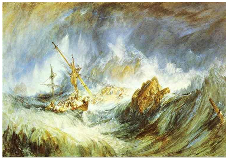
abogallery.com - Internet's biggest art collection