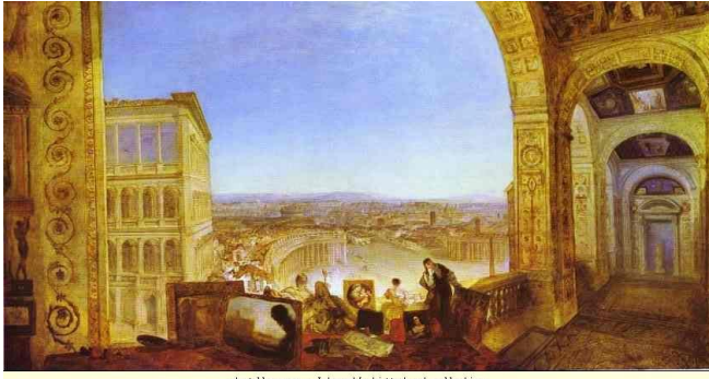
abogallery.com - Internet's biggest art collection