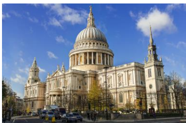
Собор Святого Павла 2 балла