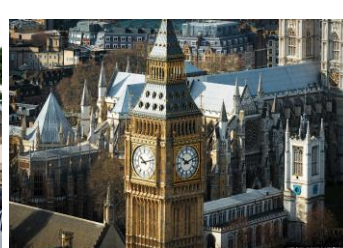
Биг Бен, 2 балла (Башня