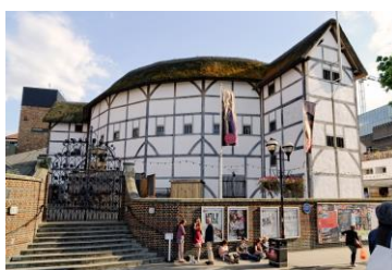
Театр "Глобус" 2 балла