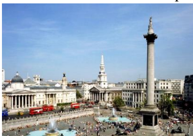
Трафальгарская площадь 2 балла , Букингемский дворец, 2 балла

Выделенная надпись Театр "Глобус" должна быть подчеркнута волнистой линией 2 балла